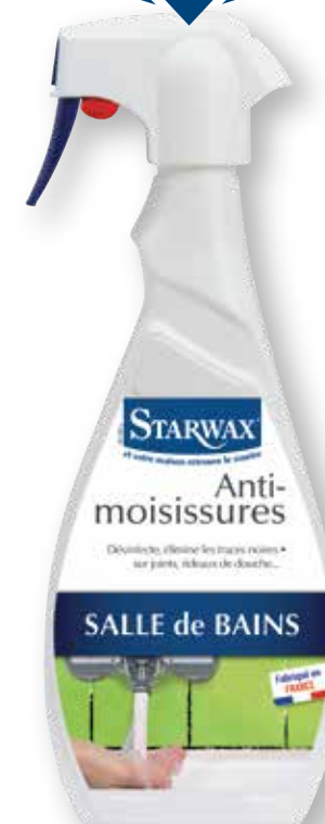
Photo non contractuelle - Dangerueux. Respecter les précautions d'emploi. Utiliser les produits bécodes avec précaution. Avant toute utilisation, lisez l'étiquette et les informations concernant le produit. N'utilisez que pour l'usage prévu.

DÉCOUVREZ ÉGALEMENT NOTRE SOLUTION ANTI-MOISSISSURES